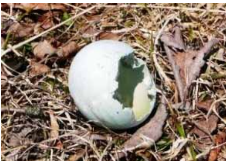
誰が運んだの？アオサギの卵 (EMC裏4/14)

日出・日入時間 4/15(4:41, 18:05) . 4/30(4:18, 18:22) . 5/14(4:00, 18:38)