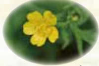
シコタンキンポウゲ