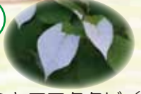
ミヤママタタビ (葉)