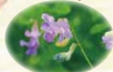
エゾノレンリソウ 7/上~