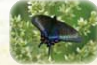
ミヤマカラスアゲハ