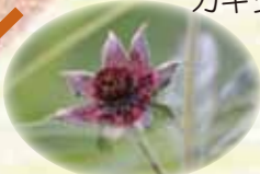
クロバナロウゲ 7/上~