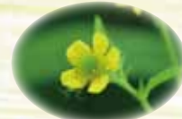
オオダイコンソウ