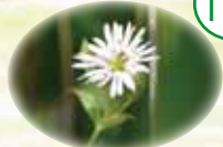
エゾオオヤマハコベ