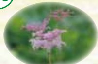
エゾノシモツクソウ 7/中~