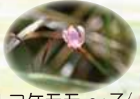
ツルコケモモ ~ 7/上