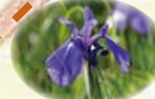
カキツバタ ~ 7/上