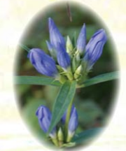
エゾリンドウ 蝦夷竜胆

種子をよく観察して、風にのせて運ぶ工夫を探してみましょう。ただ…落下地点が生育に良い場所とも限らないため数うち当たれ作戦。ヨシヤスゲもこのタイプ。