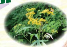
ハンゴンソウ 反魂草