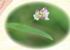
アキノウナギツカミ 秋鰻攫