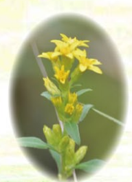
コガネギク 黄金菊