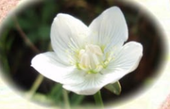
ウメバチソウ 梅鉢草