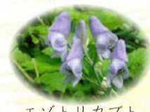
エゾトリカブト 蝦夷烏兜