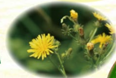
コウゾリナ 髪剃菜