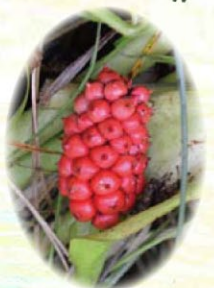
ヒメカイウ 姫海芋 (実)