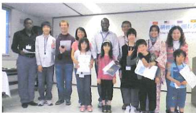
湿原に関心を持つ

メッセージカードを書いてくれたレンジャーは15人、交流会には6人のレンジャーが来てくれました。 レンジャーから7名の研修員にメッセージをプレゼント、研修員はとってもよろこんでくれました。 メッセージを送ってくれたレンジャーには証明書の活動記録に貼る、シールを送ります。 そして8月27日から、また別の国からプロフェッショナルが日本にきます。 次回もスペシャル・ミッションが！ またメッセージを募集します。