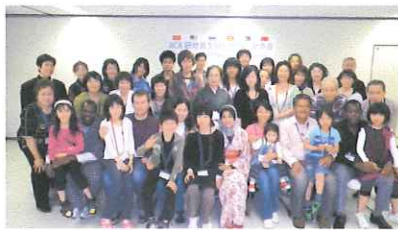
湿原を好きになる