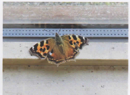
エルタテハ (あるこっと)

センター内の窓際で発見。例年、この時期になると、越冬場所を探して迷い込んできます