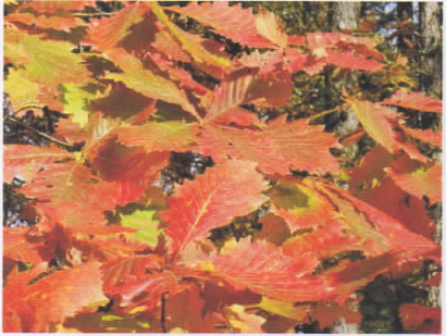
ミズナラ (塘路湖畔)

昨年よりやや遅れ気味だった今年の紅葉・黄葉ですが、10月も終わりを迎える頃、ようやく見頃を迎えました。11月の中旬を迎えた現在は、色とりどりの葉はすっかり落ち、塘路湖畔は冬枯れの景色に変わってきています。