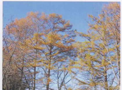
カラマツ (塘路湖畔)