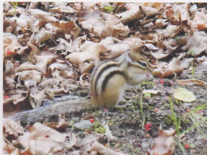
エゾシマリス (コッタロ展望台)