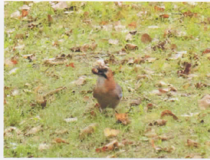
(ミヤマ) カケス (塘路湖畔)