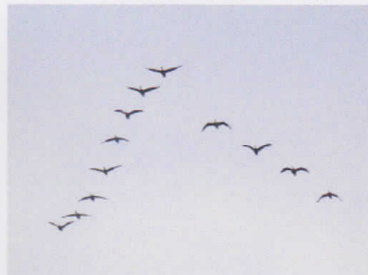
(オオ) ヒシクイ (コッタロ湿原) 独特の鳴き声とともに上空を通過していった小群。きれいなV字を描いていました