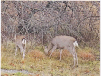
エゾシカ (コッタロ湿原)

今年の秋は暖かいせいか、11月の中旬になっても昆虫たちが活発に動き回っている姿が見られます。一方、動物たちは現在冬の準備に大忙し。活動的になった動物たちが車道近くに出てくるところもよく見かけます。