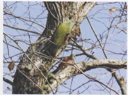
ヤマゲラ(上)とモズ(下) (塘路湖畔)