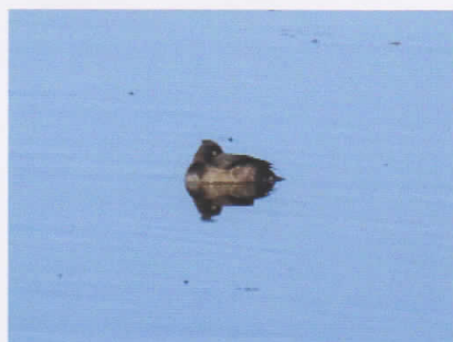
キンクロハジロ (塘路湖) 眠っていてこちらに全く気付いていなかった♀。この秋、塘路湖での確認は初でした