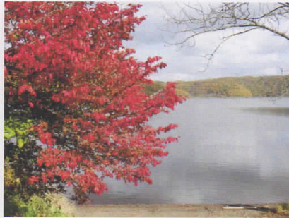
ニシキギ (塘路湖畔)

塘路湖畔で稀に見られるミズナラの紅葉。艶のある淡い色合いは独特の味わいがあります