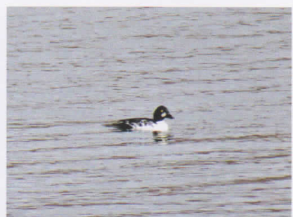
ホオジロガモ (塘路湖) 数は多くないものの、見つけやすいカモ。センター近くにいるところをよく見ます