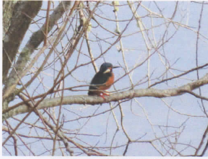
カワセミ (塘路湖畔)