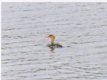
カワアイサ (塘路湖) エクリプスと思われる個体。センターの目の前で何度も潜水を繰り返していました