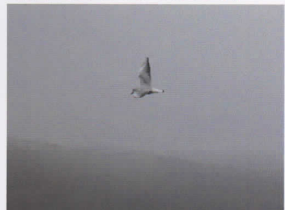
ユリカモメ (塘路湖) 濃い霧の中、目の前を通過していきました。水面にダイブして採餌する姿をよく見ます