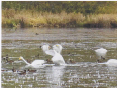
オオハクチョウ (シラルトロ湖) カモの群れに囲まれて羽を休めているところ。湖の北側で30羽ほど確認しました

晩秋の塘路湖とシラルトロ湖は水鳥たちで賑わっています。さらに先日、冬の使者オオワシの飛来も確認しました。湖面を賑わす水鳥たちと上空から獲物を狙う猛禽類。野鳥たちの賑わいは湖面が凍り付くまで続きます。