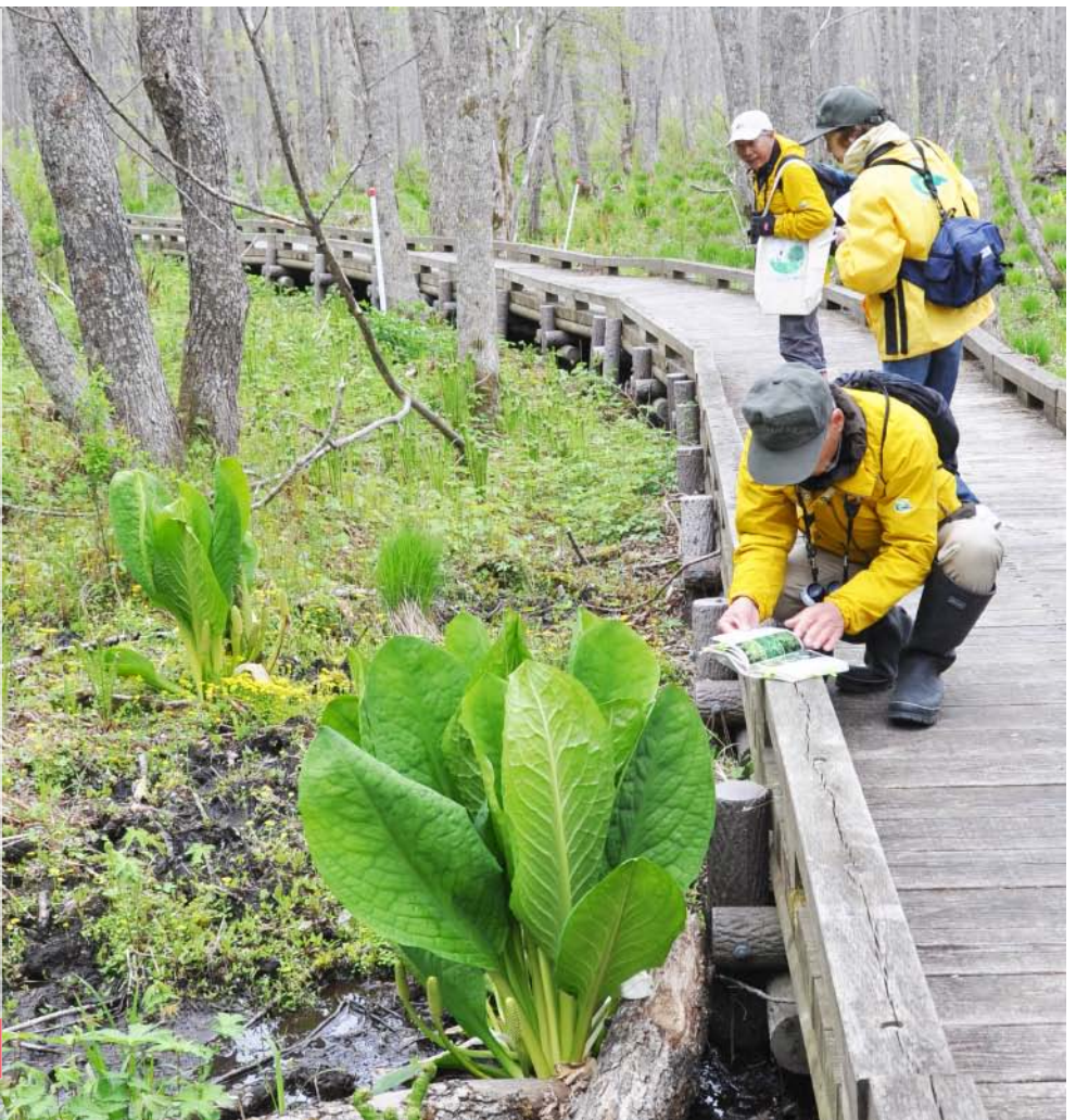
[写真] 巨大なミズバショウの葉とボランティア・レンジャー

知ってた？達古武のキャンプ場裏にステキな歩道があるって！ 釧路湿原のことが大好きなボランティア・レンジャーたちが達古武歩道で見つけた旬の花などを紹介します！ ここを目的地に来てもよし、キャンプの朝に歩いてもよし、ぜひマップ片手に来てください！