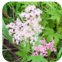
エゾノシモツケソウ