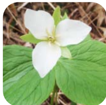
オオバナノエンレイソウ