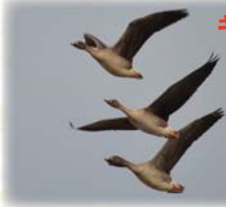
ギャハハン ギャハハン...