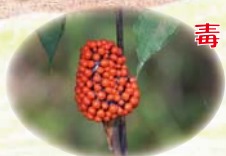
マムシグサ (コウライテンナンショウ)