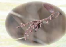
ホロムイツツジ の花芽