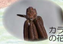
カラフトイソツツジ の花芽