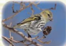
マヒワが食べ に来ます♪