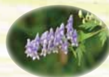
エソトリカブト 8/中～