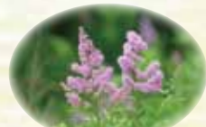
ホザキシモツケ 温根内ビジターセンター