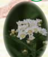
エソノコギリソウ