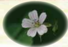
ミツバフウロ ※よく似たイチゲフウロとゲンノショウコがあるので注意