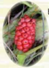
ヒメカイウ 実 8/下～