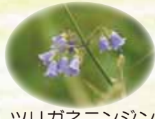
ツリガネニンジン 8/中～