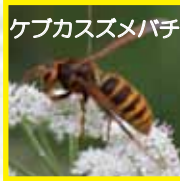
ケバカスズメバチ