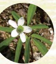
ヒメイチゲ 姫一華