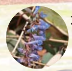
エゾエンゴサク 蝦夷延胡索