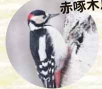
アカゲラ 赤啄木鳥