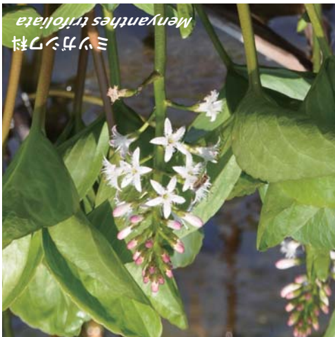
- Survivors from the Ice Age -