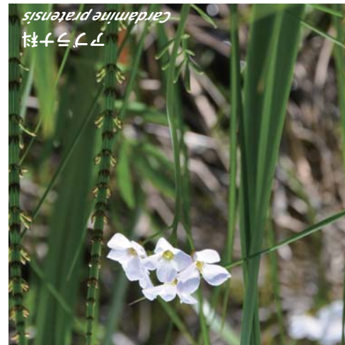
- Survivors from the Ice Age -