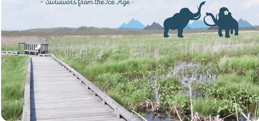
- Survivors from the Ice Age -