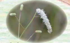
ナガボノシロワレモコウ