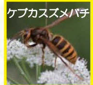
ケブカスズメバチ