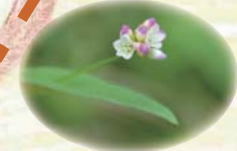
アキノウナギツカミ