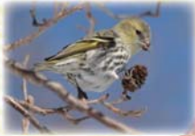
マヒワが食べ に来ます♪