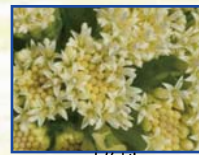
雄株 星形の小さな花が なっています