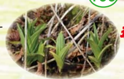
バイケイソウが 芽吹いてきました