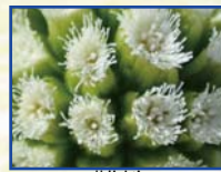
雌株 ふさふさ しています