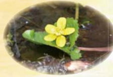
エンコウソウ 5月上旬～