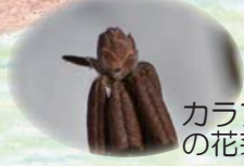
カラフトイソツツジ の花芽