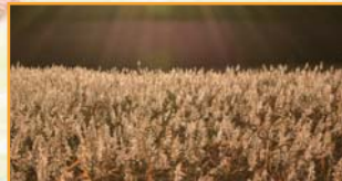
ヨシの穂に光が当たると 黄色に輝きます♪