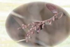
ホロムイツツジ の花芽