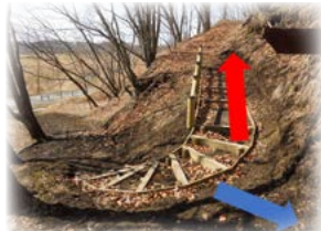
サルボ展望台登り口付近 （赤が新ルート、青が旧ルート）

改修工事のため、立ち入り禁止となっていたサルボ歩道ですが、工事の終了に伴い、利用できるようになりました。なお、以前とはコースが変わり、登り口からサルボ展望台までの旧ルートは利用できなくなりましたので、ご注意ください。（詳細は下図をご参照ください）