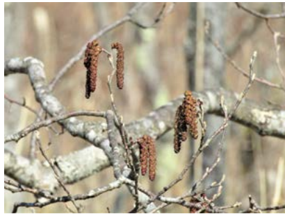
ハンノキ (塘路湖畔)

湖畔で真っ先に咲く花の一つ。地味ですが、センター前の道路沿いでたくさん見られます