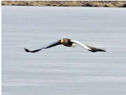
オオワシ (塘路湖畔)

氷がすっかり解けた塘路湖の湖面は水鳥たちで賑わっています。さらに、湖岸の樹上で獲物を虎視眈々と狙うオオワシ・オジロワシの姿や飛来し始めた夏鳥たちの声。早春の塘路湖畔では多様な野鳥を観察することができます。