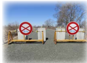
二本松橋手前 通行規制ゲート