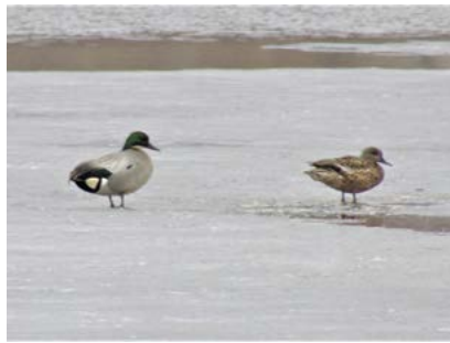
ヨシガモ (シラルトロ湖)

湖岸近くの氷上で羽を休めていた♂ (左) と ♀。この時期比較的観察しやすいカモの一つ