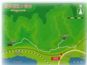
新ルート詳細図 （駐車場設置の標識より）