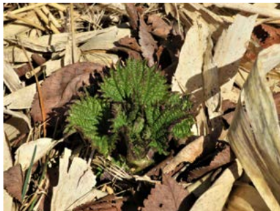
エゾイラクサ (塘路湖畔)