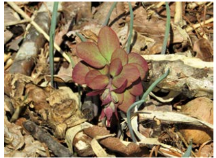
エゾエンゴサク (塘路湖畔)

湖畔で真っ先に咲く花の一つ。地味ですが、センター前の道路沿いでたくさん見られます