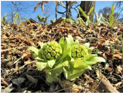
フキノトウ (元村キャンプ場)

暖かな陽気に誘われて、湖畔の大地に植物たちが続々と芽吹き始めました。枯れ色だった草原に戻ってきた緑の色彩を見ていると、春の到来を実感します。しかし、今春は植物たちの生育が昨年よりもやや遅れているようです。