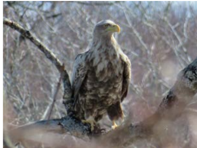
オジロワシ (塘路湖畔)