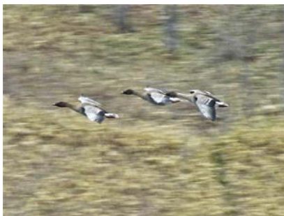
(オオ)ヒシクイ (シラルトロ湖畔)