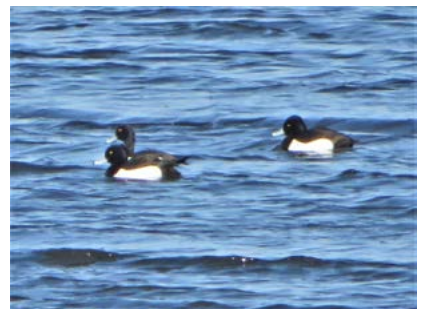
キンクロハジロ (塘路湖)