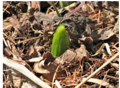
バイケイソウ (塘路湖畔)