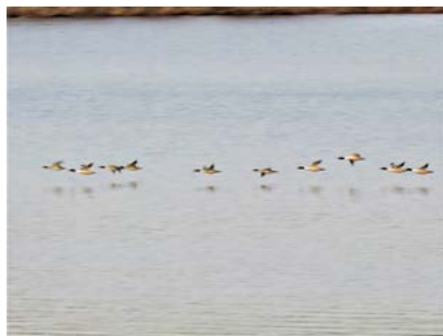
カワアイサ (塘路湖)