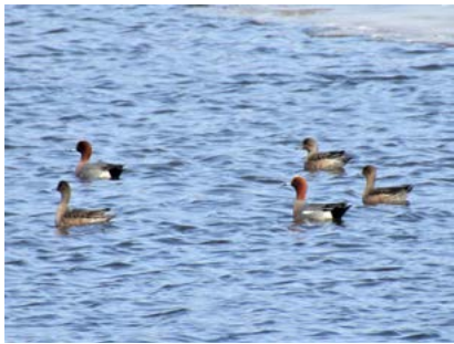
ヒドリガモ (塘路湖)