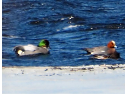
ヨシガモ、ヒドリガモ (シラルトロ湖)

ヨシガモ (左) とヒドリガモ (右)。並んでいると婚姻色の違いが良く分かる。カモ科