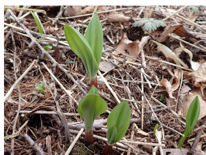
ギョウジャニンニク (行者大蒜)