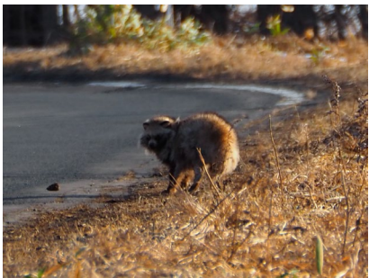
エゾタヌキ (オソツベツ原野)

冬眠しない動物も冬眠明けの動物も春になり活動を本格化しています。かなり早い段階でエゾアカガエルの合唱が聴こえている状況です。