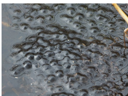
エゾアカガエル (塘路原野)