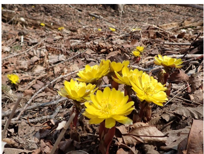
キタミフクジュソウ (北見福寿草)

この冬の積雪量の少なさも有り陽当たりの良い場所では例年より早く開花している状況で、少し早い春の到来を実感します。ここに挙げた植物以外にも一気に生長し開花していくと予想されます。