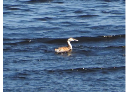
カンムリカイツブリ (シラルトロ湖)