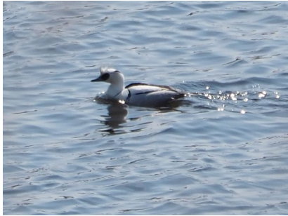
ミコアイサ (シラルトロ湖)