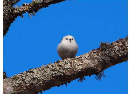
エナガ (コッタロ湿原)

ヨシガモ (左) とヒドリガモ (右)。並んでいると婚姻色の違いが良く分かる。カモ科