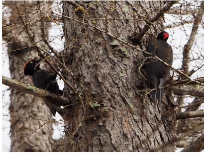
クマゲラ (塘路湖畔)