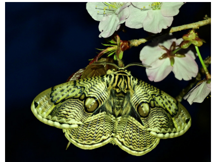
イボタガ (釧路湿原)

北海道固有亜種のモモンガ。皮膜を拡げ滑空する。夜行性で昼に見かけることが難しい哺乳類のひとつ。リス科