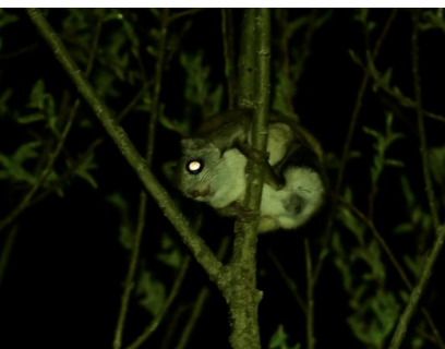
エゾモモンガ (釧路湿原)

春に池塘環境に集まり繁殖を行う両生類。葦の茎で雌を待つ雄たち。産みだす卵は青白く光る。サンショウウオ科