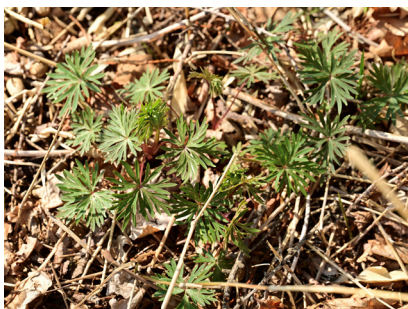
エゾトリカブト若芽 [蝦夷鳥兜]

今年は4月上旬には咲き始めました。湧水近くで春を感じる花の一つ。花言葉は「美しい思い出」。サトイモ科