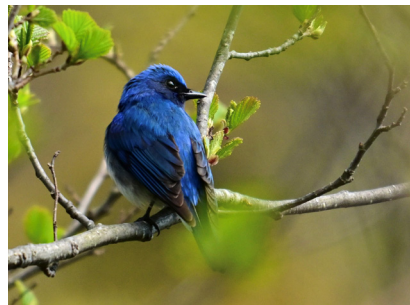
オオルリ (釧路湿原)

現在、アオサギコロニーは放卵中と思われる。繁殖期の成鳥は何とも言えない迫力を感じる。サギ科