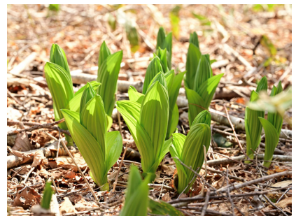
バイケイソウ [梅蕙草]

アキタブキ(左)と並んで咲くエゾエンゴサク。花言葉「妖精たちの秘密の舞踏会」ケシ科