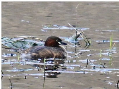
カイツブリ (シラルトロ湖)

夏鳥。一部留鳥のムクドリに比べて見掛ける季節が短い印象。雌雄別色で雄の頬は茶色い。ムクドリ科