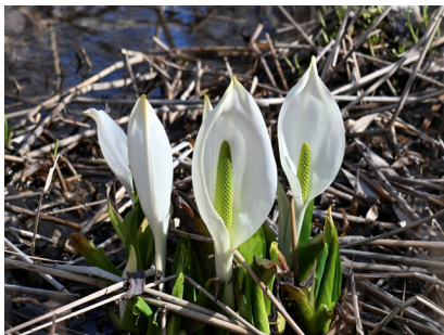
ミズバショウ [水芭蕉]

林床に群生して芽吹く植物。初夏に大きな葉を広げ存在感のある淡緑色の花を咲かせる。シュロソウ科