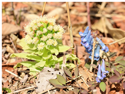
エゾエンゴサク [蝦夷延胡索]

北海道を代表する桜。今年の塘路はGW中盤に咲き始めた。花言葉は「優れた美人」バラ科