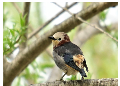
コムクドリ♂ (塘路原野)

夏鳥で「日本三鳴鳥」の一つ。雄は綺麗な瑠璃色で囀りも美しい。青い衣服に反応した。ヒタキ科