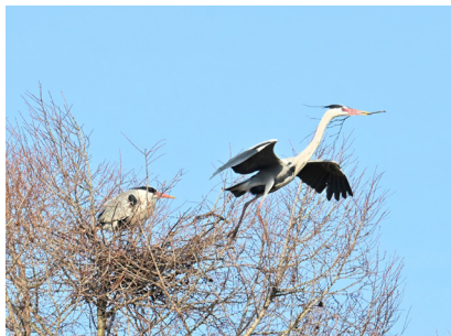
アオサギ (塘路原野)

冬鳥の姿が少なくなり、今年も夏鳥の季節がやってきました。湖畔の森や湿原帯でウグイスやムシクイなどの夏鳥たちの声も聴こえるようになりました。市民調査対象のオオジシギは、ここ5年でも確かに減っている印象。