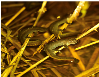
キタサンショウウオ (釧路湿原)

【動物】 春の夜に観られる動物にスポットをあててみた。メガソーラー建設で繁殖地が減らされていることで、現在、話題となっているキタサンショウウオのほか、昼間はなかなか観られない動物も、夜になると姿を現すようになる。