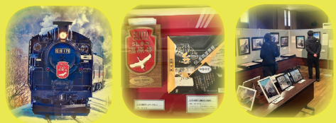
SL 受賞作品と関連資料

4月25日(土)～5月5日(火)までの期間、当館レクチャールームでは「SL冬の湿原号の四半世紀～標茶を駆け抜けた25年～」を企画展示しました。2000年より運行が開始されたSL冬の湿原号は、今年で26年目となりました。SL冬の湿原号フォトコンテスト受賞作品は、瞬間を切り取ったような鉄道写真が勢揃いし、関連資料と共に、その歴史を振り返りました。(標茶町博物館との共催行事)